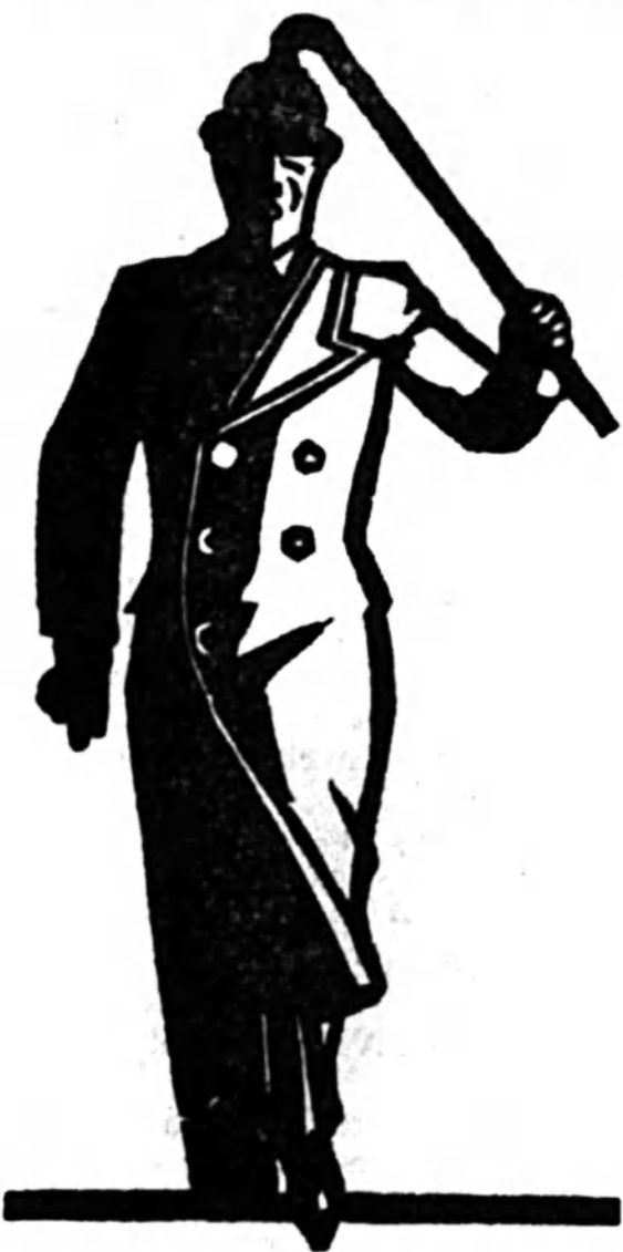
Elegáns férfi kabátszövetek SCHÜTZNÉL

Előmérkőzés: a ZFKI—MZSE II. között a Zala Kupáért.