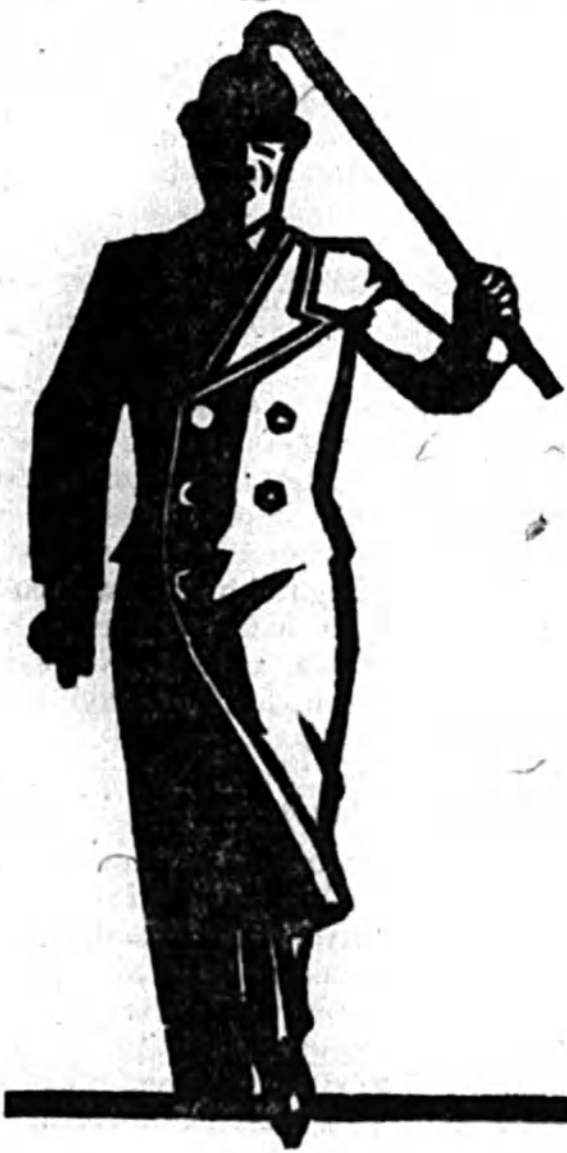
Elegáns férfi kabátszövetek SCHÜTZNÉL

A zenekar? A második felvonásközben, régi színházi szokás a zenekarnak tapsot adni, ha megérdemli. Pán György kis zenekara még nem kapott itt tapsot, pedig megérdemelné. A közönség nevében itt adjuk meg neki az elismerést, a gondos, precíz, szép zenekari muzsikáért.